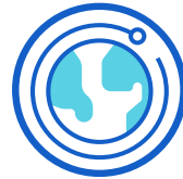
Para tu organización