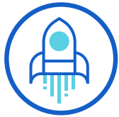
Para Ti, líder

Servimos a cada cliente con un 100 % de dedicación e integridad y diseñamos programas únicos en torno a sus objetivos y situaciones específicas, para garantizar su progreso y éxito.