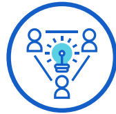
Para tu equipo